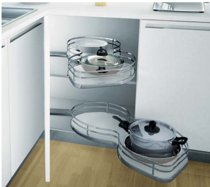
Шкаф с 2 правыми каруселями.

Популярное в Италии решение для установки под мойкой. Инновационный механизм карусели без центральной штанги. Оставляет свободное пространство для установки мойки, смесителя, измельчителя пищевых отходов или водонагревателя. Легкий монтаж на боковую стенку и дно шкафа по шаблону. Для установки второй карусели используйте полку, как на фото, или крестовину.